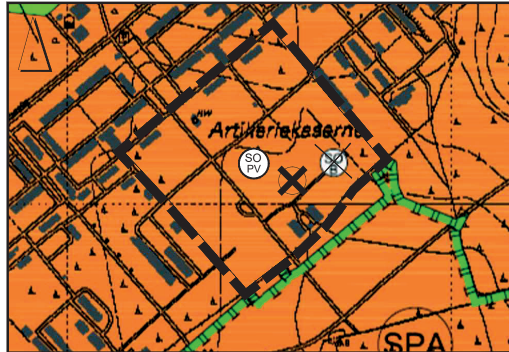
Auszug aus dem rechtswirksamen Flächennutzungsplan vom 16.12.2015