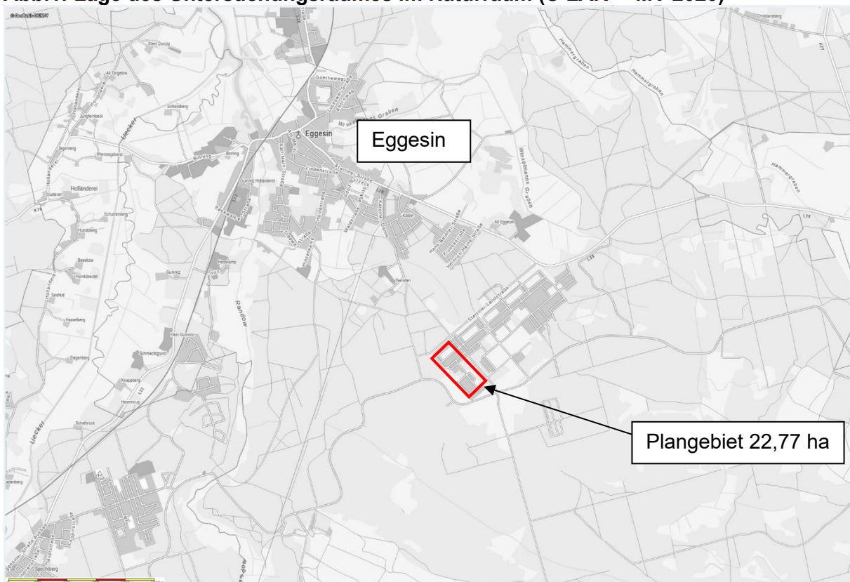
Abb.1: Lage des Untersuchungsraumes im Naturraum

Mit diesem vom Bebauungsplan Nr. 20/2019 „Solarpark Eggesin-Karpin II abgeschichteten Umweltbericht werden in Zusammenhang mit der Begründung und der Planzeichnung zum Entwurf der 6. Änderung des Flächennutzungsplanes der Stadt Eggesin die Stellungnahmen der Behörden und sonstigen Träger öffentlicher Belange entsprechend § 4 Abs. 2 BauGB eingeholt und die Offenlegung nach § 3 Abs. 2 BauGB durchgeführt.